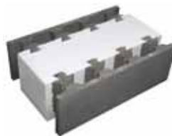
ME400 600 x 400 x 200 mm