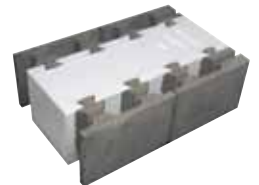
ME40Y puolikkaat, yhdistelmäbarkko 600 x 400 x 200 mm