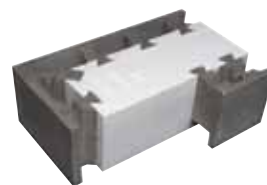
ME40K kulma 600 x 400 x 200 mm